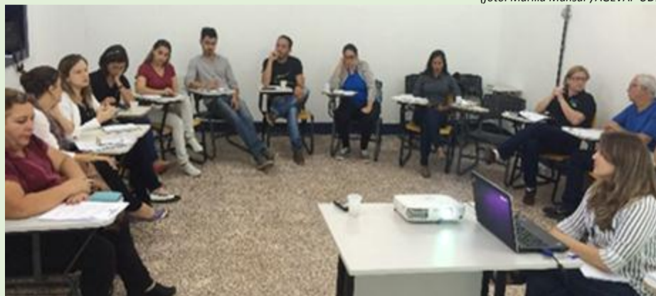
Diretoria e Câmara Técnica do CBH-MPS participam da 21ª reunião conjunta

A nova diretoria e os representantes da Câmara Técnica (CT) Permanente de Instrumentos de Gestão e Legal promoveram a 21ª Reunião Conjunta dessas instâncias do Comitê Médio Paraíba do Sul (CBH-MPS). Realizada no dia 25 de abril, no Instituto Federal (IFRJ) de Pinheiral, o encontro começou com a aprovação da ata da reunião anterior e da alteração da resolução CBH-MPS de 2017, sobre o Plano de Aplicação Plurianual de 2017/2020. Durante a reunião, a nova diretoria do CBH apresentou seu planejamento e metas e definiu a comissão julgadora do II Concurso de Projetos de Boas Práticas Ambientais do Comitê.