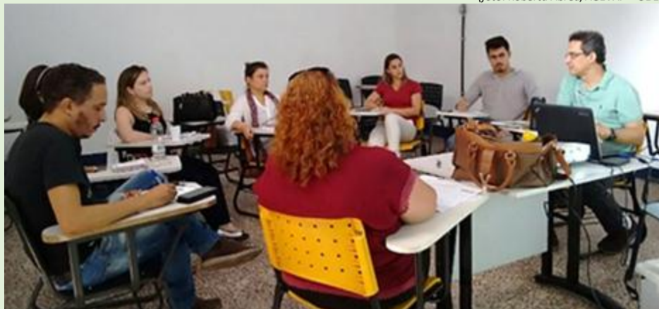
Diretório do CBH-MPS e funcionários da AGEVAP durante sua 48ª reunião ordinária

Na tarde do dia 25 de abril, a diretoria do Comitê de Bacia Hidrográfica da Região do Médio Paraíba do Sul (CBH-MPS) realizou sua 48ª reunião ordinária. A pauta contou com a aprovação da ata da reunião anterior, apresentação dos novos membros e definição de seus representantes nas instituições. Além disso, houve o alinhamento e repasse das informações sobre os projetos realizados pelo Comitê e os recursos disponíveis a serem aplicados pelo mesmo.