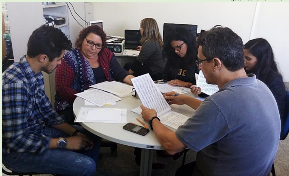
Diretoria do CBH-MPS presente na 49ª reunião do Diretório do Comitê

Aconteceu no dia 7 deste mês, a 49ª Reunião do Diretório do Comitê Médio Paraíba do Sul. O plenário realizado na sede do Comitê, discutiu a aprovação das atas da 48ª Reunião do Diretório e 7ª Reunião Extraordinária do Diretório; houve a apresentação do Termo de Referência do Curso de Gestão Municipal de Recursos Hídricos; a aprovação de alteração no calendário de reuniões do Diretório e fechamento do local das reuniões; discussão sobre a sustentabilidade do Sistema (aprovação de minuta de carta a ser enviada ao INEA/CERHI); definição de pauta da reunião plenária; informe sobre a situação do Plano de Bacia; informe sobre o Sistema de Informações - SIGA; aprovação do Questionário de Avaliação de eventos/ações promovidos pelo Comitê; parceria Comitê Médio Paraíba do Sul X Ministério da Agricultura; avaliação do RX de Esgotamento Sanitário; informes sobre o Curso de “Capacitação em Ações de Comunicação Integrada no contexto dos Comitês de Bacia Hidrográfica”; e assuntos gerais.