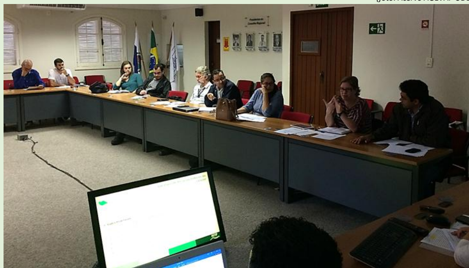
Integrantes da Câmara Técnica presentes em sua 39ª reunião

O Comitê Médio Paraíba do Sul promoveu, no dia 15 de agosto, sua 39ª reunião da Câmara Técnica Permanente de Instrumentos de Gestão e Legal. A reunião aconteceu na cidade de Volta Redonda e teve como pauta: aprovação da ata da 5ª Reunião Extraordinária da Câmara Técnica; histórico do Plano de Bacia da Região Médio Paraíba do Sul; levantamento das informações solicitadas no Termo de Referência para elaboração do Plano de Bacia e verificação dos dados secundários existentes e propostas de estudos primários que poderiam ser realizadas; alteração de calendário de reuniões da CT; III Simpósio Água Boa – Programação; e informes sobre o curso de "Capacitação em ações de comunicação integrada no contexto dos comitês de bacia hidrográfica".