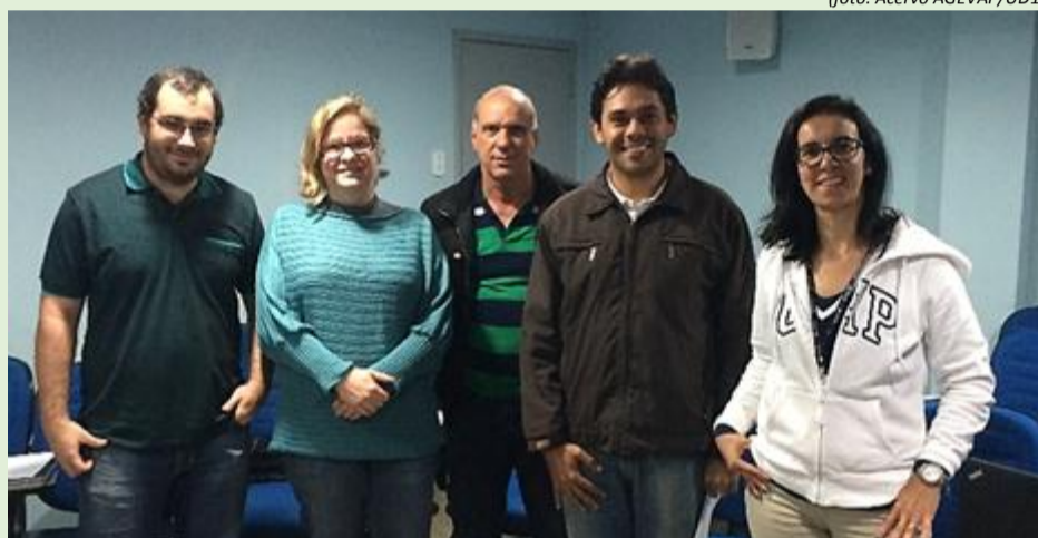
Participantes da 5ª reunião Extraordinária da Câmara Técnica Permanente de Instrumentos de Gestão e Legal do Comitê

O Comitê Médio Paraíba do Sul realizou, no último dia 4, sua 5ª reunião Extraordinária da Câmara Técnica Permanente de Instrumentos de Gestão e Legal do Comitê. A reunião, que aconteceu no auditório do Serviço Autônomo de Água e Esgoto (SAAE), discutiu a aprovação da ata da 38ª reunião da Câmara Técnica; estudo do Plano de Aplicação Plurianual; e assuntos gerais.