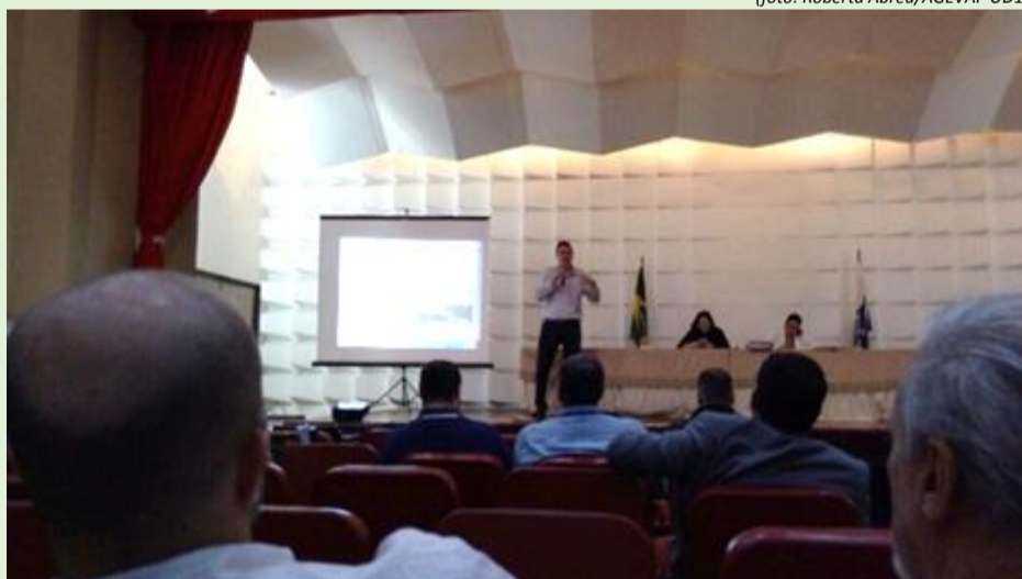
Membros e convidados na 75ª reunião do CERHI

O CBH-MPS marcou presença, no dia 12 de julho, na 75ª reunião Ordinária do Conselho Estadual de Recursos Hídricos do Rio de Janeiro. A reunião, que aconteceu na cidade do Rio de Janeiro, teve como pauta a aprovação da minuta da ata 74ª R.O. CERHI-RJ; aprovação das datas previstas para o CERHI-RJ no calendário anual; minuta de Resolução CERHI-RJ que autoriza a criação de Grupos de Trabalho e define diretrizes para a sua formação; minuta de Resolução CERHI-RJ que altera o plano de aplicação dos recursos financeiros no FUNDRI da subconta do comitê da bacia hidrográfica Médio Paraíba do Sul (Ref. Res. CBH MPS nº64 de 25/05/2017); minuta de Resolução CERHI-RJ que aprova a aplicação de recursos financeiros do FUNDRI da subconta do comitê da região hidrográfica da Baía de Guanabara e dos Sistemas Lagunares de Maricá e Jacarepaguá para custeio do Contrato de Gestão (Ref. Res. CBH BG nº36, de 10/10/2016); minuta de Resolução CERHI-RJ que dispõe sobre a indicação da Associação Pró-Gestão das Águas da Bacia Hidrográfica do rio Paraíba do Sul- AGEVAP como entidade delegatária das funções de Agência de Água, do Comitê da bacia hidrográfica Baía da Ilha Grande – Região Hidrográfica