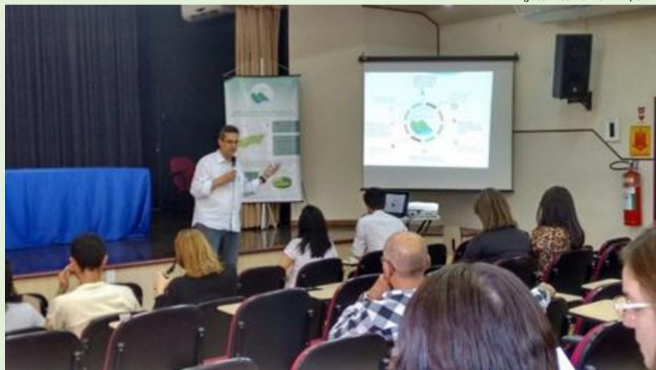
Presidente do Comitê Médio Paraíba do Sul na abertura da Oficina de Diagnóstico: RX do Esgotamento Sanitário

Nos dias 13 e 14 de julho, o Comitê Médio Paraíba do Sul (CBH-MPS) realizou a primeira etapa da “Oficina de Diagnóstico: RX do Esgotamento Sanitário”, cujo objetivo é identificar as particularidades e a realidade do esgotamento sanitário dos 19 municípios da região hidrográfica. O evento, que aconteceu no Instituto Federal de Educação, Ciência e Tecnologia (IFRJ) em Pinheiral, contou com a participação do diretório do CBH, dos integrantes da Universidade Federal Rural do Rio de Janeiro (UFRRJ) de Três Rios, da UniFoa, do Centro Universitário Geraldo Di Biase (UGB/FERP), da Universidade Federal