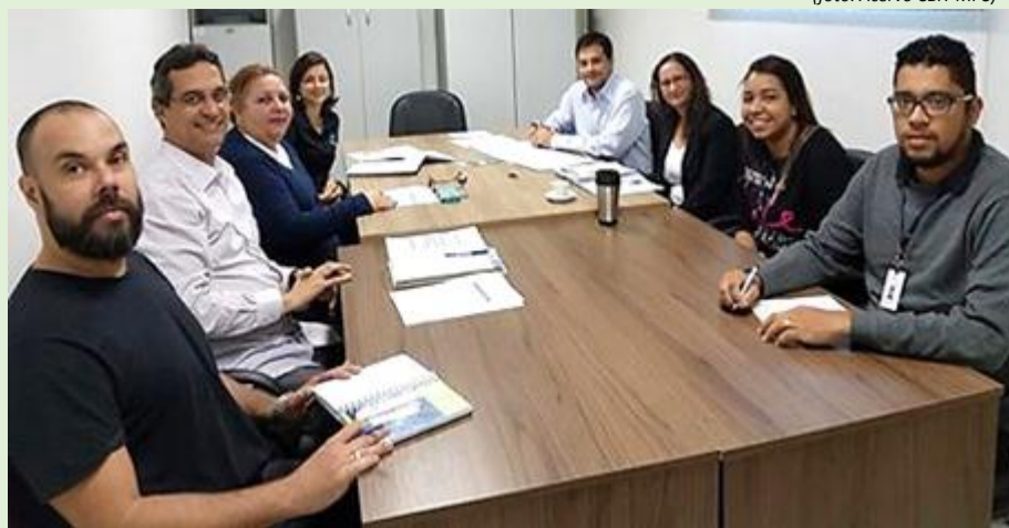
Representantes do Diretório do CBH-MPS, da AGEVAP e da AEDB durante reunião

O Comitê de Bacia da Região Hidrográfica do Médio Paraíba do Sul (CBH-MPS), no dia 4 de maio, reuniu-se com a equipe da AGEVAP e com os representantes da Associação Educacional Dom Bosco (AEDB) para pensar um novo projeto. A novidade é o curso “Capacitação em Ações de Comunicação Integrada no contexto dos Comitês de Bacia Hidrográfica”, que será ministrado pela AEDB, vencedora do Ato Convocatório nº 01/2017, com o objetivo de apresentar noções básicas de comunicação, oratória, meios de comunicação e media training aos membros do CBH. A previsão é de que a formação aconteça em dois sábados: 5 e 12 de agosto.