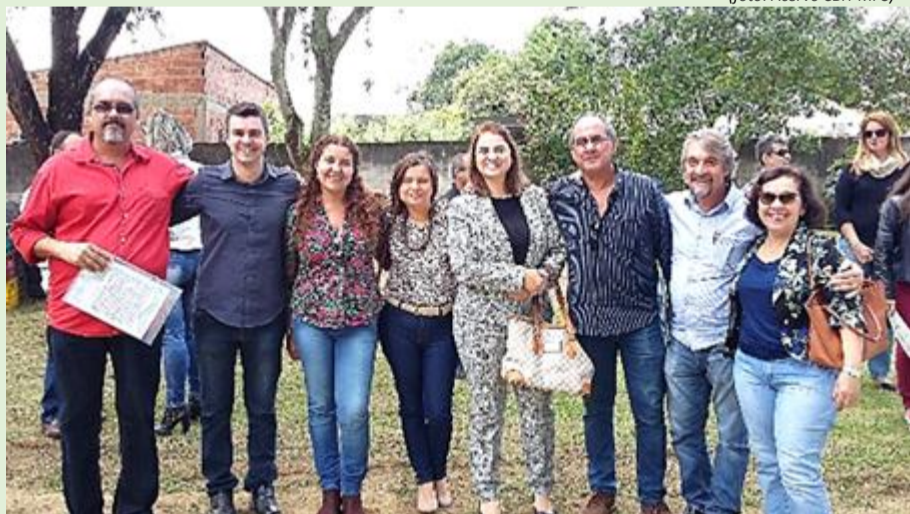
Representantes do CBH-MPS e da Prefeitura de Resende durante assinatura do projeto "Oficina de Florestas"

No dia 12 de maio, a Prefeitura Municipal de Resende, através da Agência de Meio Ambiente de Resende (AMAR), assinou o convênio para a implantação do Projeto de Educação Ambiental com a Associação Pró-Gestão das Águas da Bacia Hidrográfica do Rio Paraíba do Sul (AGEVAP). O projeto chamado "Oficina de Florestas" contempla o plantio de mudas de plantas típicas da Mata Atlântica no Horto Florestal da cidade.