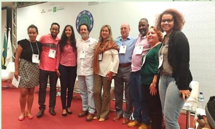
Membros do Comitê Médio Paraíba do Sul e outros Comitês em Brasília

O Ministério do Meio Ambiente (MMA) e a Agência Nacional de Águas (ANA) promoveram o V Encontro Formativo Nacional de Educação Ambiental para Gestão das Águas em Brasília. Realizado de 9 a 11 de maio, o evento teve por objetivos principais fomentar as discussões a respeito do Processo Cidadão – encontro preparatório para o 8º Fórum Mundial da Água – e fortalecer as Câmaras Técnicas, os Grupos de Trabalhos e os educadores ambientais, que trabalham diretamente com recursos hídricos em todo o país.