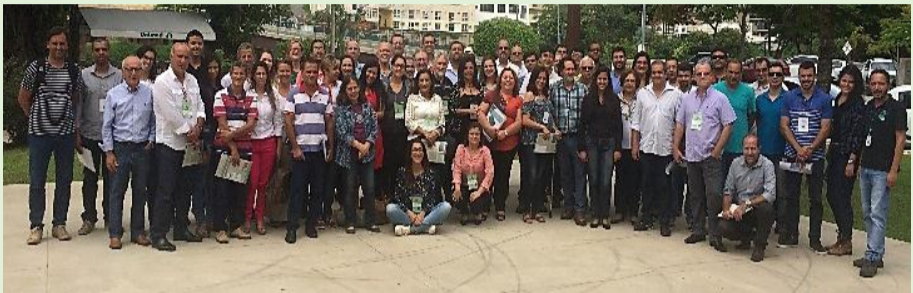
12ª Reunião Extraordinária do Comitê do Médio Paraíba do Sul

O Comitê do Médio Paraíba do Sul realizou, no dia 28 de março, sua 12ª Reunião Extraordinária. A pauta do encontro foi: aprovação da ata da 25ª Reunião Plenária Ordinária; apresentação do papel dos entes envolvidos na gestão de recursos hídricos, relatório de execução e prestação de contas dos recursos financeiros de projetos utilizados para custeio da AGEVAP; lançamento do atlas da Região Hidrográfica do Médio Paraíba do Sul; fórum dos segmentos (eleição e posse): Poder Público, Usuários de água e Sociedade Civil; situação dos recursos do FUNDRHI e assuntos Gerais. A reunião iniciou às 9h no Itapoã Clube em Barra do Piraí, Rio de Janeiro.