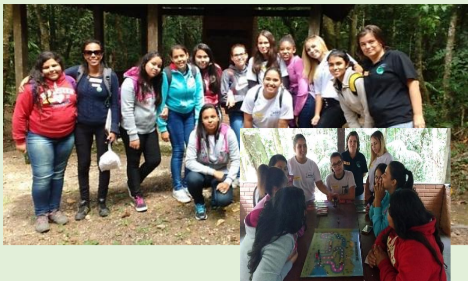
Estudantes participam de campeonato do jogo Água, Consciência e Vida.

No dia 22 de março, foi realizado no Parque Nacional do Itatiaia uma evento para celebrar a data. O evento, Promovido pela Prefeitura Municipal de Itatiaia, Escola Municipal Léa Duarte Jardim, Associação Educacional Dom Bosco, ICMBio e a Cruz Vermelha, o encontro contou com a participação de membros do CBH-MPS, de estudantes universitários e de alunos do ensino fundamental. Os estudantes realizaram atividades de caminhada ecológica e também um campeonato do Jogo Água, Consciência e Vida