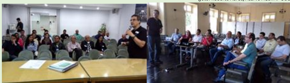
Representantes das prefeituras convidadas para as reuniões de Volta Redonda e Paraíba do Sul, respectivamente

O Comitê, dando continuidade a sequência de reuniões com gestores municipais, realizou, nos dias 6 e 12 de junho, os últimos encontros com representantes das prefeituras de sua região. As reuniões, realizadas em Paraíba do Sul e Volta Redonda, contaram com a participação de integrantes das prefeituras de Paraíba do Sul, Vassouras, Paty do Alferes, Miguel Pereira, Volta Redonda, Barra Mansa, Barra do Piraí, Piraí, Pinheiral, Quatis e Comendador Levy Gasparian, além dos membros do Comitê. O encontro teve como objetivo apresentar os trabalhos que vêm sendo desenvolvidos pelo Comitê Médio Paraíba do Sul ao longo dos últimos anos e as iniciativas que estão em andamento, visando a integrar os municípios e articular a ação do CBH-MPS, otimizando a gestão de recursos hídricos na região, bem como, fomentar o debate de como está a situação de esgotamento sanitário nos municípios.