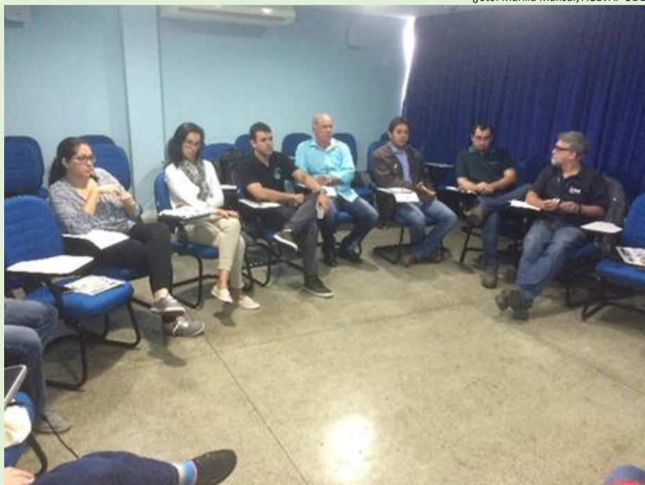
Membros da Câmara Técnica reunidos para a 38ª plenária

O Comitê Médio Paraíba do Sul realizou, no último dia 13, a 38ª Reunião da Câmara Técnica Permanente de Instrumentos de Gestão e Legal. A reunião, que aconteceu no auditório da Estação de Tratamento do SAAE de Barra Mansa, contou com a seguinte pauta: aprovação da ata da 37ª Reunião de Câmara Técnica; apresentação do Termo de Referência do curso "Gestão Municipal de Recursos Hídricos" para algumas definições; definição de vazão ecológica pensando no enquadramento da RH-III; estudo do Plano de Aplicação Plurianual e assuntos gerais.