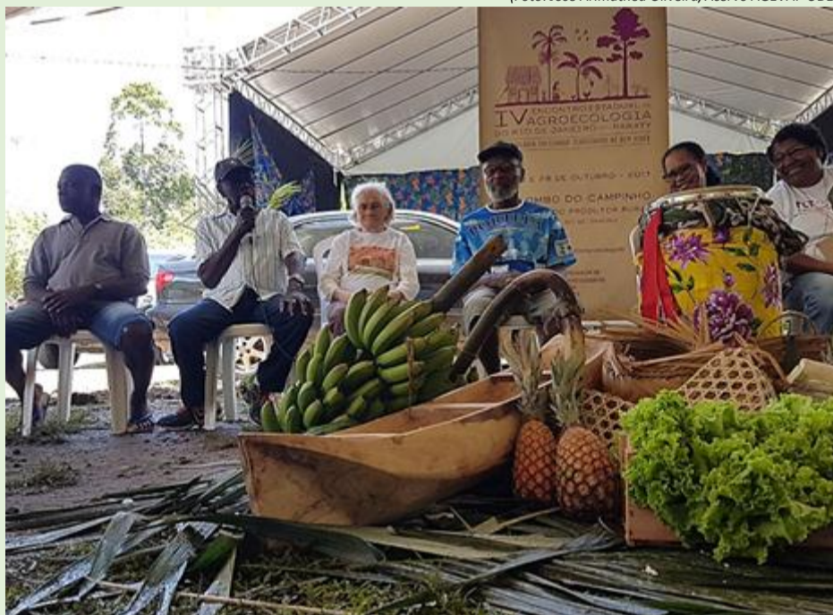
A abertura do encontro foi marcada pela troca de experiência sobre agroecologia entre os participantes