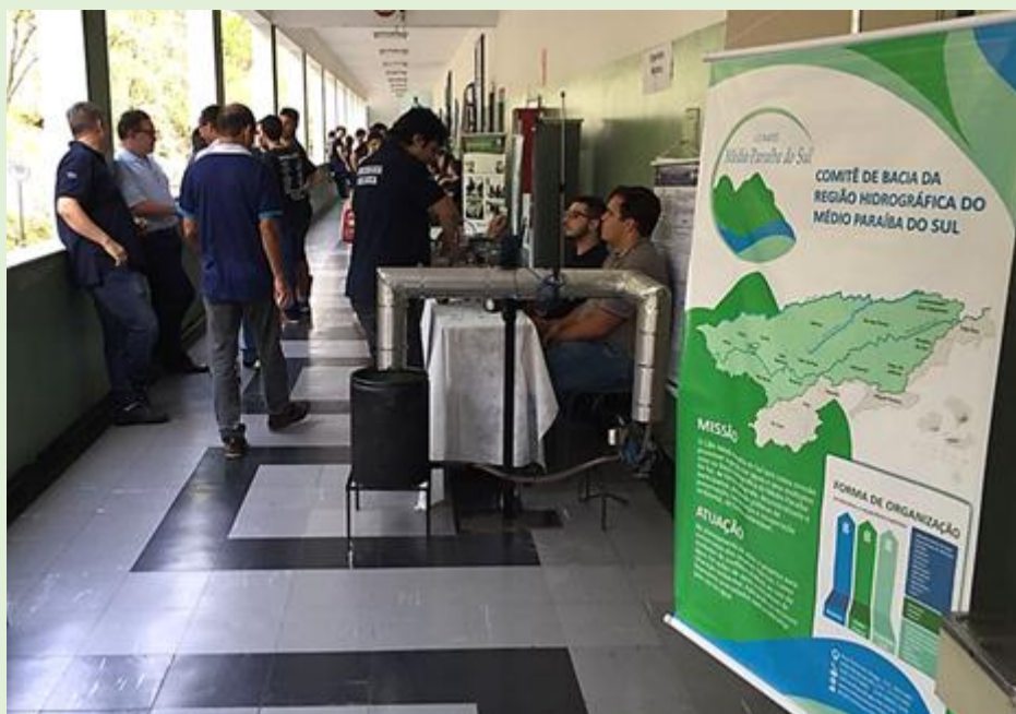
Comitê Médio Paraíba do Sul apresenta seus trabalhos em Feira de Educação e Cultura

A Feira de Educação e Cultura (FEC), organizada pelo Colégio de Aplicação do Centro Universitário de Barra Mansa, foi realizada no dia 27 de outubro, na instituição. Com o tema "Inovação, meio ambiente, fato local e impacto mundial", a programação contou com diversas atividades como oficinas, roda cultural e apresentações de projetos. O Comitê Médio Paraíba do Sul foi convidado para participar da feira com um stand apresentando suas propostas e de que forma é desenvolvido seu trabalho para os participantes.